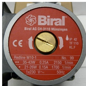
Figure 2 : Plaque signalétique de la pompe

Si une plage de puissance (p. ex. de 35 à 43 W) est indiquée au lieu d'une valeur unique, on peut utiliser la valeur la plus élevée.