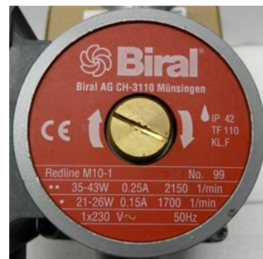
Figure 2 : Plaque signalétique de la pompe, source : Biral Redline M10-1

Si une plage de puissance (p. ex. de 35 à 43 W) est indiquée au lieu d'une valeur unique, on peut utiliser la valeur la plus élevée.