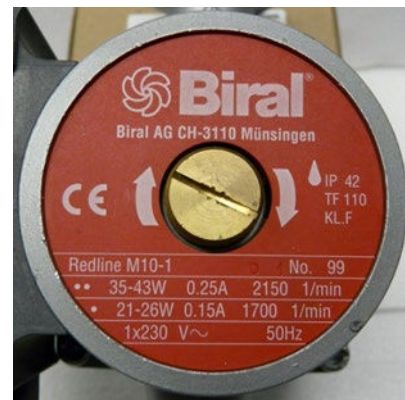
Abbildung 2: Typenschild Pumpe

Falls anstatt einer Leistungsangabe ein Leistungsbereich (z.B. 35 Watt - 43 Watt) angegeben ist, so darf der höhere Leistungswert verwendet werden.