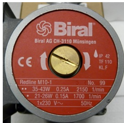
Figure 2: Plaque signalétique de la pompe, source: Biral Redline M10-1

Si une plage de puissance (par ex. de 35 à 43 W) est indiquée au lieu d'une valeur unique, on peut utiliser la valeur la plus élevée.