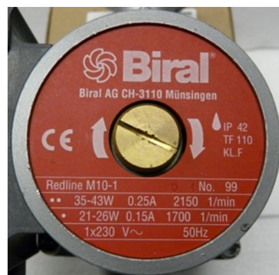
Figure 2: Plaque signalétique de la pompe

Si une plage de puissance (p. ex. de 35 à 43 W) est indiquée au lieu d'une valeur unique, on peut utiliser la valeur la plus élevée.